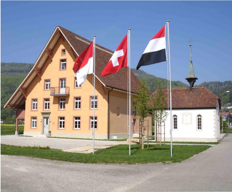
Gäuer Forum Schälismühle mit Adam Zeltner-Haus und St. Jakobs-Kapelle im Juni 2007

Es steht in Oberbuchsiten , mitten im Kanton Solothurn, im Herzen des Gäu und ist mit der Bahn und dem Auto erreichbar. Ab Bahnhof Oberbuchsiten sind es zu Fuss nur drei Minuten bis zum einzigartigen Ensemble. Von der Autobahn kann es ab den Anschlüssen Oensingen oder Egerkingen erreicht werden. Es stehen genügend Parkplätze zur Verfügung.